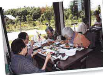
十勝産の食材を使った料理、美味しかったです