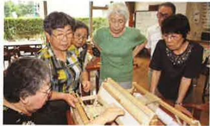
手織りコースター作り