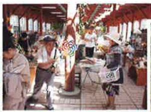
お土産も忘れずに…