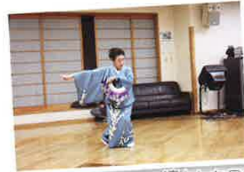
凛とした日本舞踊の舞い