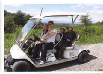
カートに乗って レッツゴー!!