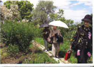
きれいな緑に癒されて