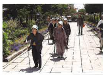
かわいいお花が出迎えてくれました