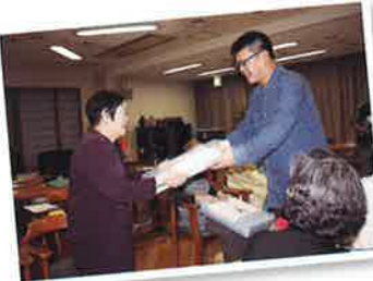
皆さん元気です！米寿のお祝い