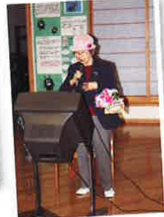
熱唱 カラオケタイム♪