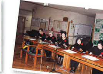
大正琴同好会「はまなす」による演奏