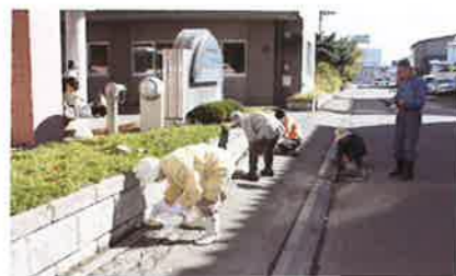
秋の苑周辺環境整備