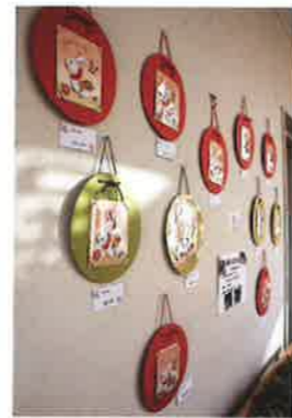
そうび苑作品展示会