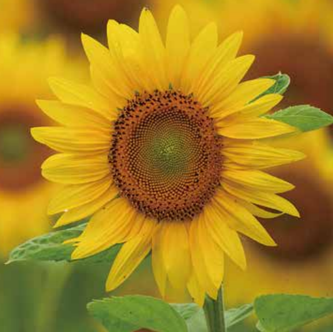
「ひまわり」撮影地：音更