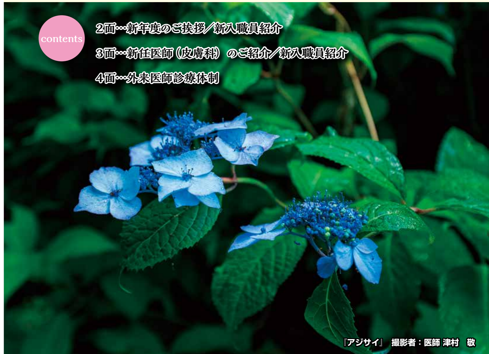
【アジサイ】