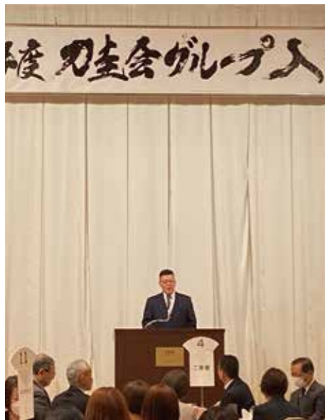
大々的な開催は5年ぶりの入職式