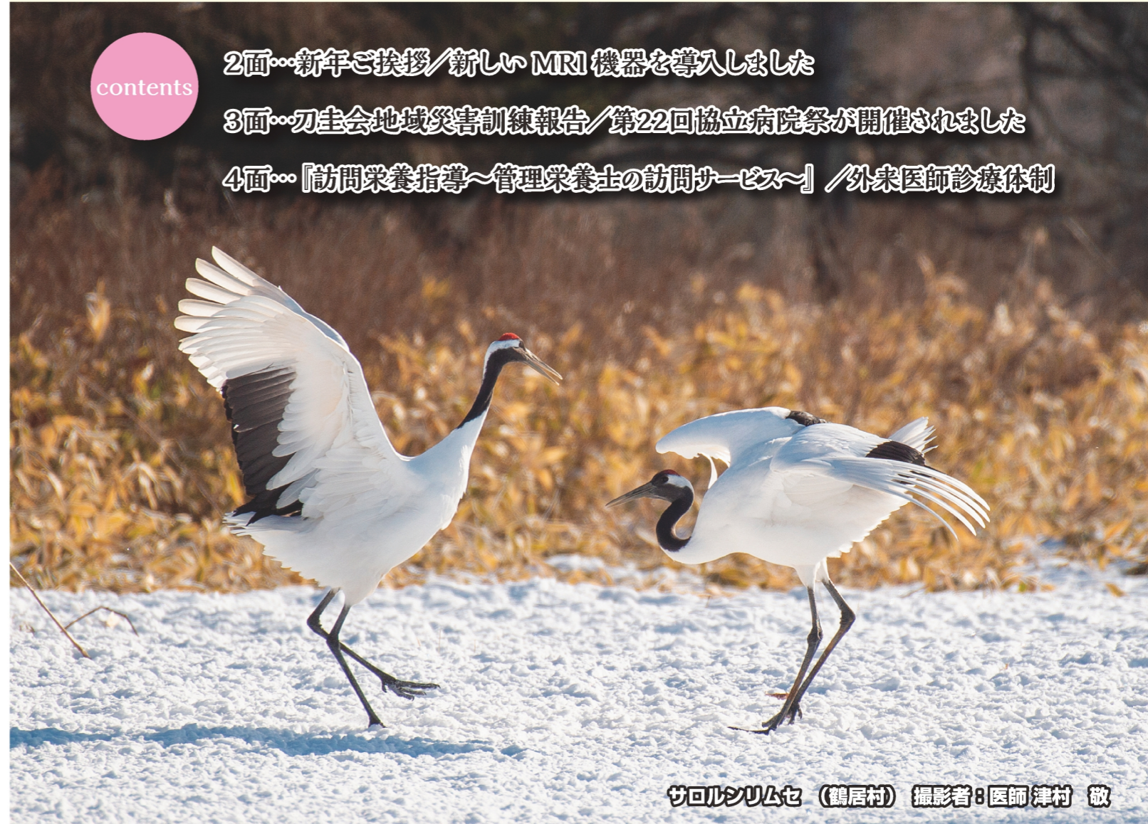
ザロルンリムセ (鶴居村)