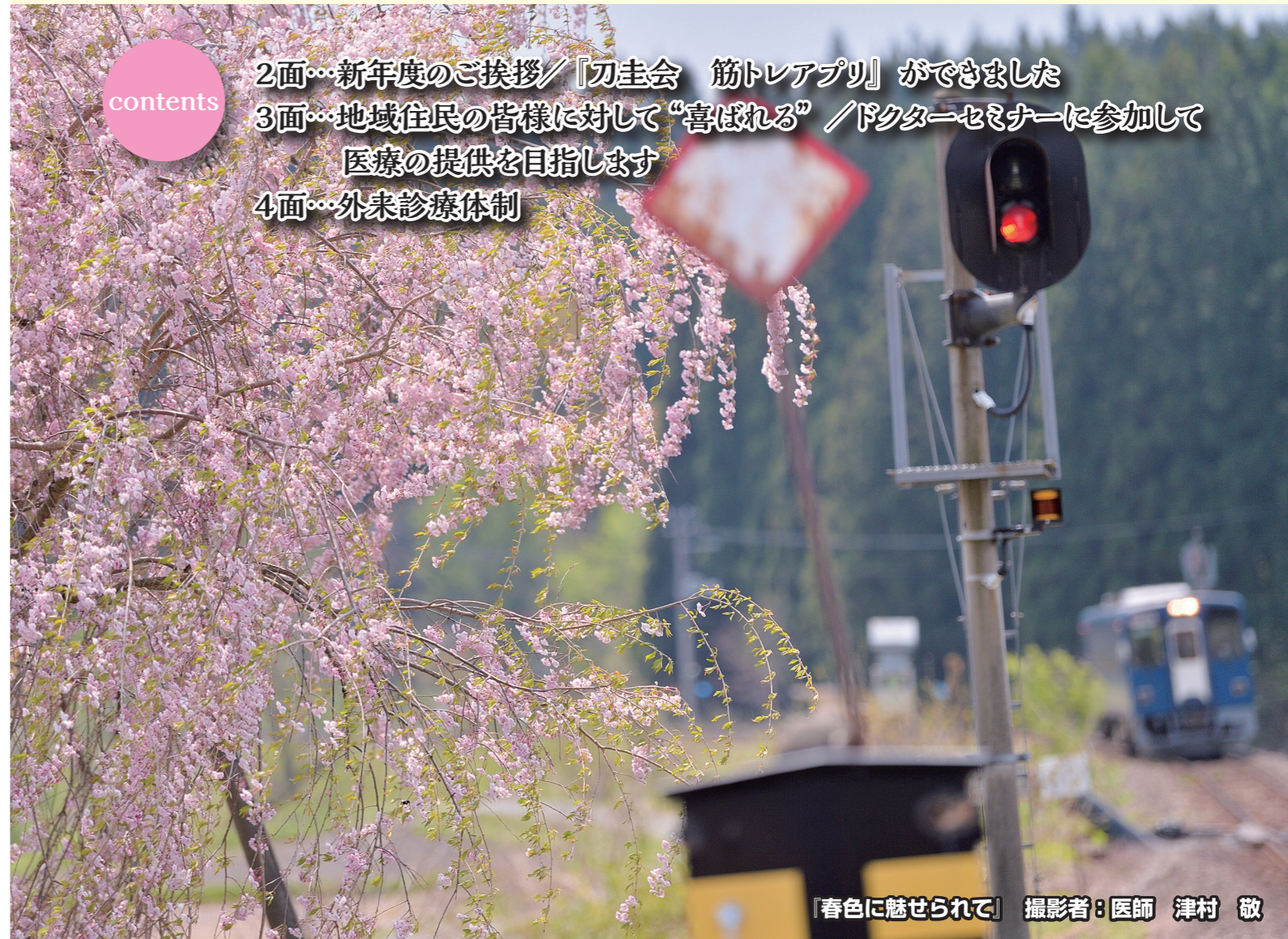
『春色に魅せられて』