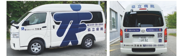
最新装備のハイエースウェルキャブ

病院無料送迎バスがダイナミックな刀圭会マーク入りのインパクトのあるデザインになりました