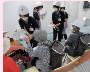
トリアージの実施訓練

協立病院玄関前では、災害時に負傷者が多数押し寄せたことを想定した、トリアージ訓練を実施しました。町内会の皆様にも負傷者役としてお手伝いいただいたおかげで、万が一の実動に向け、実践さながらの訓練ができました。