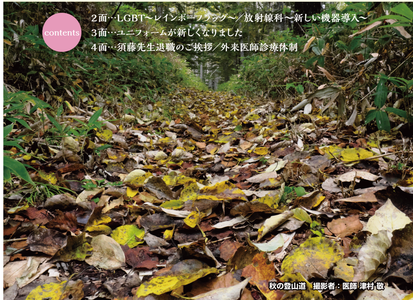
秋の登山道