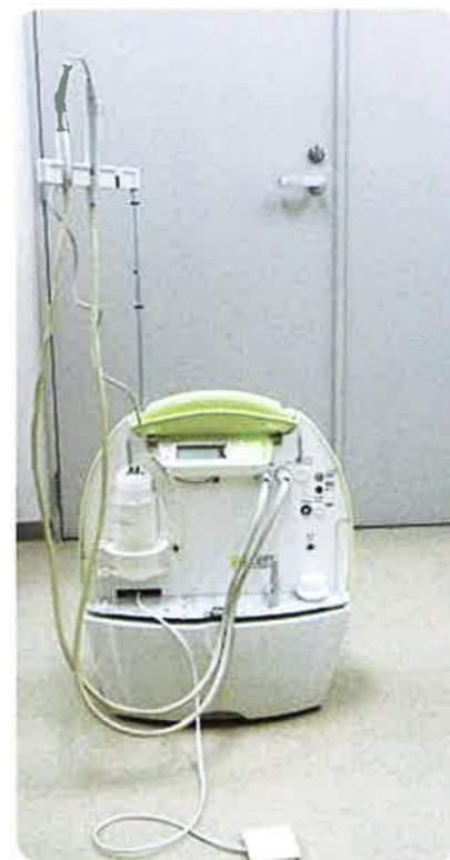
ポータブル式切削器械