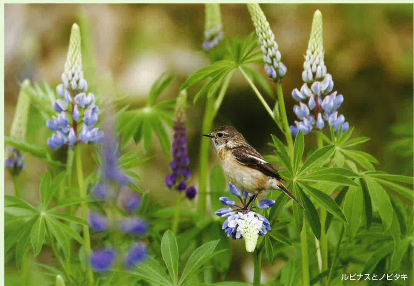
ルピナスとノビタキ